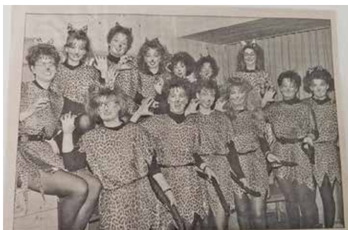
Katzen im Dorf. So hieß eine der Glanznummern des Faschings in der Gurktaler Gemeinde Gnesau. Die Akteure zeigten viel Talent und verstanden es, das Publikum köstlich zu unterhalten. In Gnesau standen die Narntesen ganz im Zeichen des Jubiläums „100 Jahre Gemeinde Gnesau“, welches heuer in vielfältiger Weise gefeiert wird.